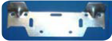
Soporte de pared para ZF-101

Antes de instalar el orinal, asegúrese de que la tubería de vaciado este limpia y libre de residuos